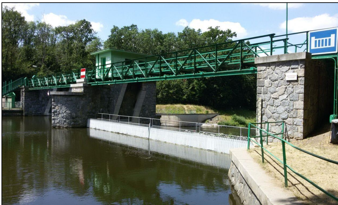
Foto č. 4 – Provizorní hrazení z horní vody po montáži (pohled z podjezí VD)